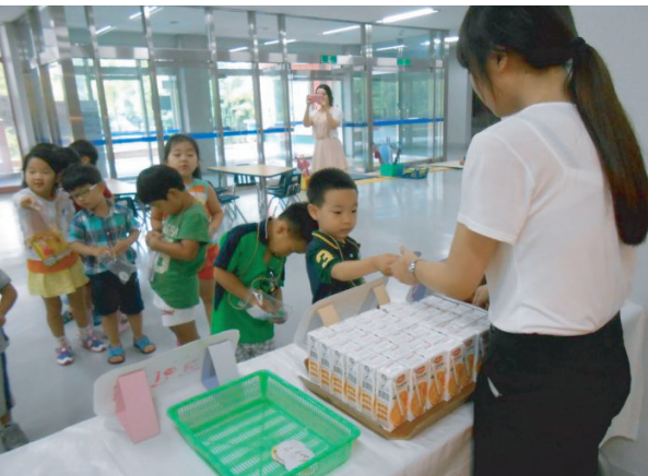
<4-2> 코인을 이용하여 간식을 구매하고 있다.

8월 둘째 주는 지역사회기관과의 연계를 통하여 지역문화를 참여해보거나 놀이를 해보는 활동들을 하였다. 8월 11일은 솔브릿지대학 수영장을 방문하여 수영도 해보고, 솔브릿지대학 1층 식당에서 피자, 스파게티, 불고기 덮밥 등의 음식을 먹었다.