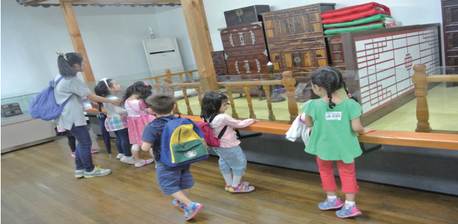
유아들이 전시물을 보고 있는 모습이다.

9월의 교통기관, 우리나라라는 주제에 맞추어 9월 12일 우송유치원의 하얀구름반과 파란하늘반이 한밭교육박물관을 방문했다. 유아들은 박물관에서 다양한 전통놀이를 경험했다. 평소 접해보지 못했던 놀이에 유아들 모두 흥미를 느끼고 적극적으로 참여했다. 또 여러 전