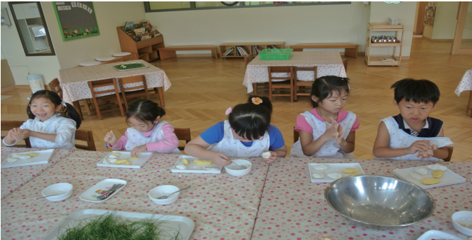
9월 17일 유치원의 모든 유아가 추석을 맞이하여 송편 빚기를 경험했다. 3세 유아들은 콩 송편을 만들고,