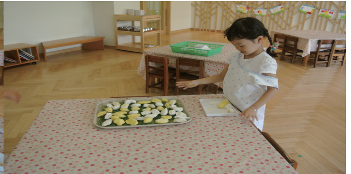
4세와 5세 유아들은 녹두 송편을 만들었다. 이날 직접 만든 송편으로 간식을 먹었다.