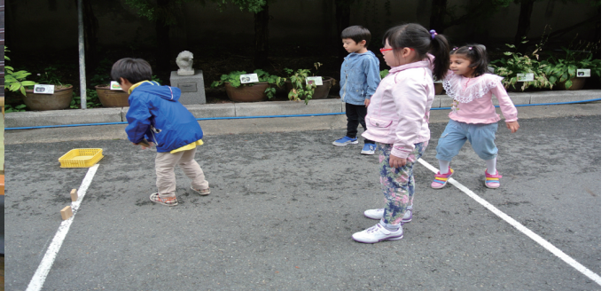
유아들이 전통놀이인 비석치기를 하고 있는 모습이다.

9월의 교통기관, 우리나라라는 주제에 맞추어 9월 12일 우송유치원의 하얀구름반과 파란하늘반이 한밭교육박물관을 방문했다. 유아들은 박물관에서 다양한 전통놀이를 경험했다. 평소 접해보지 못했던 놀이에 유아들 모두 흥미를 느끼고 적극적으로 참여했다. 또 여러 전