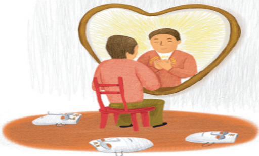
‘학벌, 직업, 돈 보다 자신을 사랑하는 마음이 가장 자신을 행복하게 한다’ 는 의미를 나타낸 그림이다.

당신은 자기가 언제나 최고라고 생각하는 멋진 사람입니다. 자신이 최고라고 생각하는 만큼 타인을 최고라고 생각하고 배려해 나의 도움이 필요한 친구들에게 도움을 주어 자신의 당당함을 유지해 가세요.