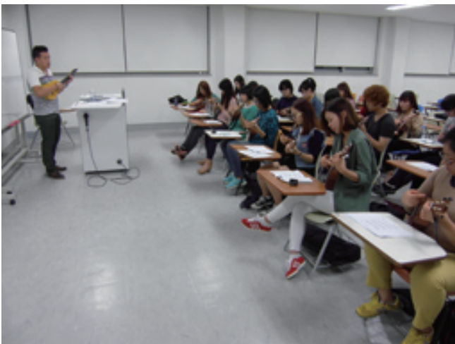
우쿨렐레를 배우고 있는 학생들

우송대학교 유아교육과 학생들은 9/7일~10/10까지 우쿨렐레를 배우게 되었다.