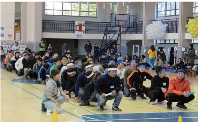
아버님들께서 이어달리기를 위한 준비를 하고 계시는 모습이다.

10월 27일 일요일 우송대학교 서 캠퍼스 체육관에서 우송유치원 가족 운동회를 실시하였다.