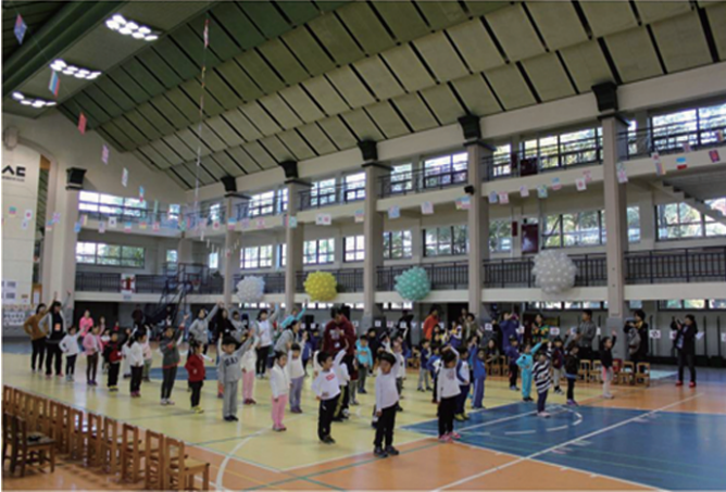
어린이 리듬체조를 하고 있는 모습이다.