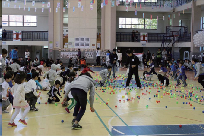
유아들이 볼풀공을 정리하고 있는 모습이다.