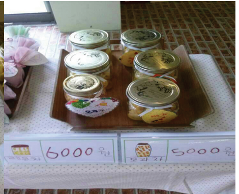
만 5세 유아들이 직접 담근 레몬차와 모과차의 모습이다.