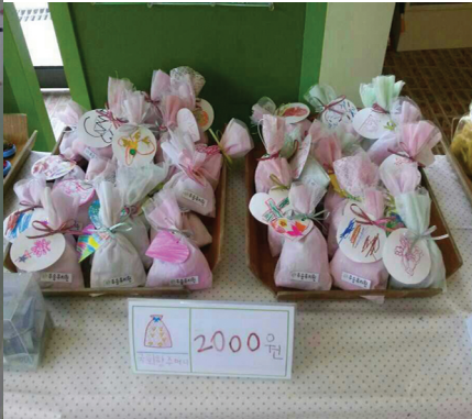
만 3세 유아들이 만든 포푸리의 모습이다.