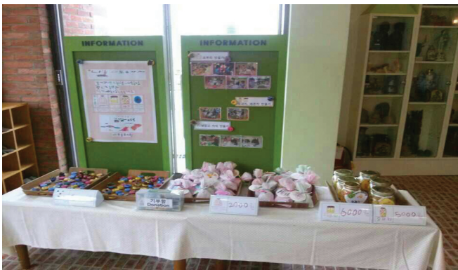
우송유치원의 나눔과 도움가게의 모습이다.

12월 10일, 만 5세 유아들이 사전활동으로 아름다운 가게를 견학해보고 이번 유치원 행사에 대해 함께 이야기를 나누며 어떤 식으로 진행해나갈지 계획해보았다.