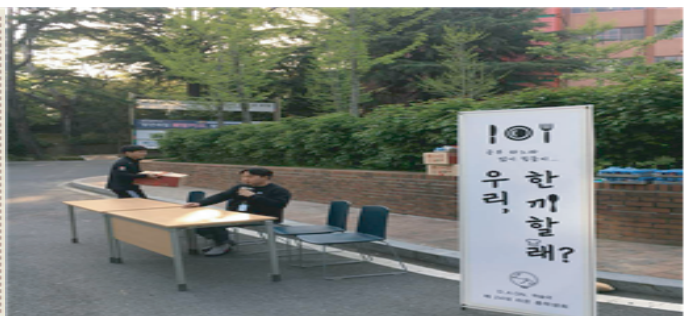
<2-4> 행사를 준비하고 있는 총학생회의 진행 모습이다.

2018년 4월 19일 오후 6시, 우송대학교 서 캠퍼스 학생회관 앞에서 재학생들을 대상으로 제24대 총학생회 라온이 개최하는 '우리, 한 끼 할래?'행사가 진행되었다. '우리, 한 끼 할래?' 행사는 우송대학교 학생들에게 석식을 지원하는 행사로 중간고사 시험 기간으로 인해 늦은 시간까지 학교에서 공부하는 학생들을 격려하려는 취지로 진행된 행사이다. 행사 시간은 행사 전날인 4월 18일 오후 4시에 우송대학교 제24대 라온 총학생회의 페이스북 페이지를 통해 공지되었다. 정확한 장소는 행사 시작 20분 전에 공