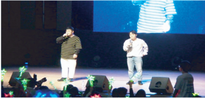
<2-1> 가수 길구봉구가 축하공연을 하는 모습이다.

2018년 4월 5일 오후 6시부터 11시까지 우송대학교 예술회관에서 새내기 콘테스트가 진행되었다. 1부에는 개회사, 총학생회 집행부 소개, 동아리 축하공연, 단과대학별 학생회장 축하공연, 심사위원 소개, 새내기 가요제와 초대 가수 길구봉구와 슈퍼비, 엠블런스의 축하공연이 진행되었다. 축하공연이 끝나고 2부에서는 단과대학 홍보 및 UCC 영상발표, 동아리 축하공연, 시상식 및 처장님의 총평 그리고 폐회사 순서대로 진행되었다. 모든 공연이 끝나고 수상이 진행되는데 대상은 외식조리학과가 수상하였으며 최우수상은 글로벌 호텔 매니지먼트학과가 우수상은 글로벌 의료 서비스 경영학과가 수상하였다. 또한, 응원상은 유아교육과가 수상하였으며 UCC 영상 대상은 Sol International School 단과대학이 수상하였다. 새내기 콘테스트