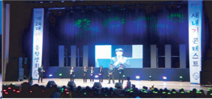
<2-2> 총학생회 집행부를 소개하는 모습이다.

2018년 4월 5일 오후 6시부터 11시까지 우송대학교 예술회관에서 새내기 콘테스트가 진행되었다. 1부에는 개회사, 총학생회 집행부 소개, 동아리 축하공연, 단과대학별 학생회장 축하공연, 심사위원 소개, 새내기 가요제와 초대 가수 길구봉구와 슈퍼비, 엠블런스의 축하공연이 진행되었다. 축하공연이 끝나고 2부에서는 단과대학 홍보 및 UCC 영상발표, 동아리 축하공연, 시상식 및 처장님의 총평 그리고 폐회사 순서대로 진행되었다. 모든 공연이 끝나고 수상이 진행되는데 대상은 외식조리학과가 수상하였으며 최우수상은 글로벌 호텔 매니지먼트학과가 우수상은 글로벌 의료 서비스 경영학과가 수상하였다. 또한, 응원상은 유아교육과가 수상하였으며 UCC 영상 대상은 Sol International School 단과대학이 수상하였다. 새내기 콘테스트