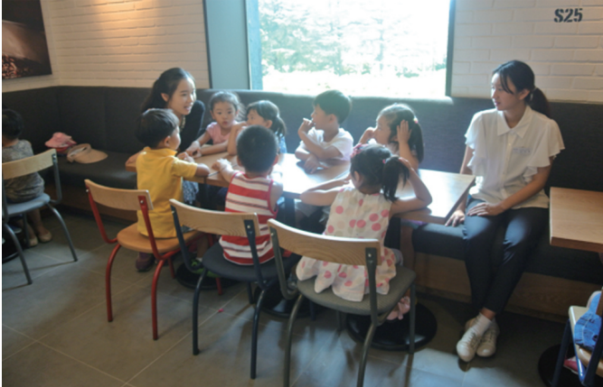
유아들이 빙수를 기다리며 이야기를 나누고 있다.

8월 9일, 우송유치원 만 3, 4, 5세 유아들이 밖에서 외식을 해보는 경험을 하였다.