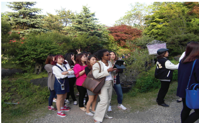
<1-2> 허브랜드를 관람하는 모습이다.

5월 7일 수요일에 2, 3학년 학생들은 봄의 향기가 가득한 상수 허브랜드로 현장학습을 다녀왔다. 이 현장 학습은 MT를 대체하여 다양한 허브에 관련된 상식을 알아가고 2, 3학년 학생들의 돈독한 선·후배 관계와 화합을 추진하고자 주최된 행사였다. 이날 방문하였던 상수 허브랜드는 충청북도 청원군 남이면에 위치한 최 규모의 허브랜드로써, 2만 5천여 평의 부지와 3,000평의 유리온실을 소유하고 있는 곳이다. 야외정원에서는 자생하는 야생화들과 라벤더, 박하, 페리 왕클 등의 중부지방에서 월동 가능한 허브들을 살펴볼 수 있었고, 유리온실 내에서는 1,000여 종 이상의 다양한 허브를 감상해볼 수 있었다. 상수 허브랜드에 도착한 후 학생들을 위해 관계자분께서 허브에 관한 소개를 해주셨고, 허브는 88올림픽 이후에 많이 유입되어 잘 알려지게 되었다.' 라는 우리나라 허브의 기원과 '허브를 키우는 방법' 과 같은 허브와 관련된 기본적인 상식도 설명해 주셨다. 그 후 학생들은 관계자분의 안내에 따라 설명을 들으며 상수 허브랜드를 둘러보았다. 5시 45분부터 약 1시간 동안 향초 만들기 체험을 하였고 7시 반까지 '허브의 성'이라는 레스토랑에서 천연 꽃을 이용한 '꽃밥' 을 먹으며 독특한 저녁 시간을 가졌으며 그 이 후에는 자유시간이 주어졌다. '다양한 허브의 특징 찾기' 를 위해 열심히 관찰하면서 학생들 모두 허브에 대한 지식을 쌓아가는 알찬 시간을 보냈다.