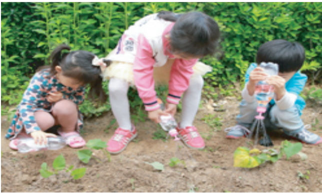
<4-2> 유아들이 모종에게 물을 주고 있다.

5월 14일에는 3세, 4세, 5세 모두 야외 수업을 진행하였다. 수업 주제는 고구마 모종 심기였으며 미술 영역에 준비된 재료들도 모종 심기와 연관이 있는 것들이었다. 3세 아람, 다솜반에서는 텃밭의 고구마 모종을 쉽게 구분할 수 있게 돌에 노랑 빨강 파랑으로 칠하는 미술 활동을 했고, 4세 누리반, 슬기반에서는 모종에 물을 뿌릴 수 있는 물 조리개를 꾸미는 활동을 했다. 이날은 간식도 야외에서 먹고, 큰 마당과 작은 마당 모두 유아들이 자유롭게 놀이할 수 있는 시간을 가져서 더욱 즐거운 시간이었다.