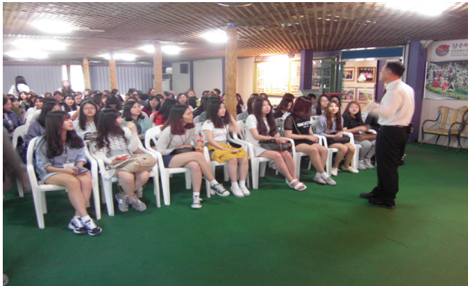
<1-1> 허브에 대한 설명을 듣고 있다.