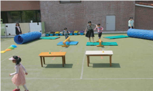
<4-1> 유아들이 작은 마당에서 놀이를 하고 있다.

5월 2일, 어린이날 행사로 오전에는 직접 햄버거를 만들어 먹기도 하고, 오후에는 우송대학교 음악동아리연구회에서 유아에게 익숙한 동요를 우쿨렐레로 연주하였고 인형극동아리에서 동극을 준비해서 선보이는 시간을 가졌다. 꿈꾸는 방에 불꽃장을 마련하여 유아가 마음껏 몸을 던지고 놀 수 있도록 준비하고, 1층 베란다에서는 비눗방울 불기가 한창이었다. 유아가 준비된 놀이 코스를 완주하고 나면 작은 마당에서 주스를 마시며 휴식을 취하기도 했다.