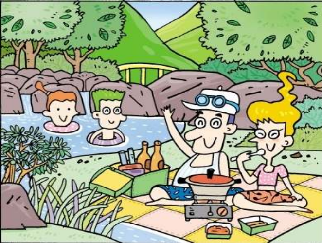
< 찾을 그림 >