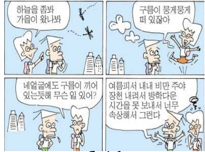
< 뭉게구름 >